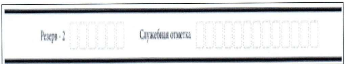
Рис. 5. Поля для служебного использования

Поля для служебного использования «Резерв-2» и «Служебная отметка» не заполняются (рис. 5).