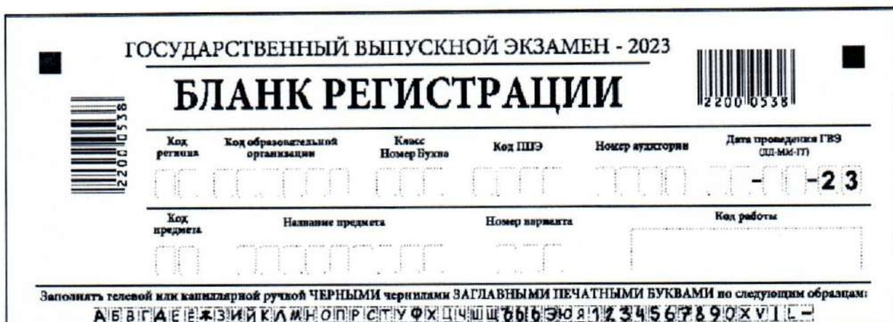
Рис. 2. Верхняя часть бланка регистрации